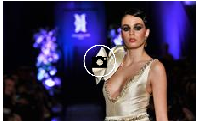
📷 Propuestas de gala y ceremonia desfilan en la Semana de la Costura del Ateneo