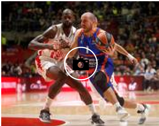
📷 El Estrella Roja-Valencia Basket, en imágenes